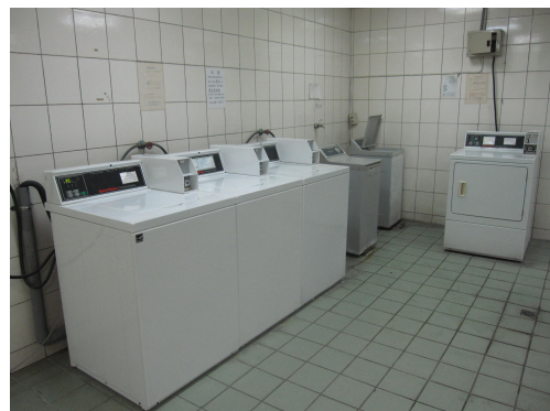
洗衣房(投幣式洗衣、烘衣機)