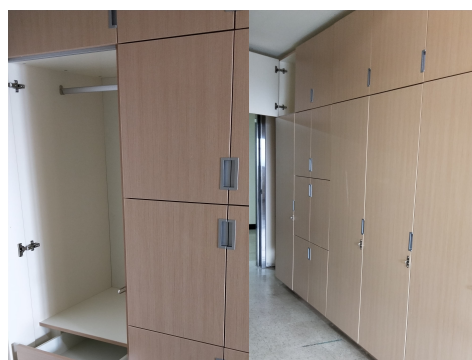
寢室衣櫃、儲物設備