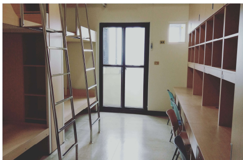
寢室床組、書桌設備